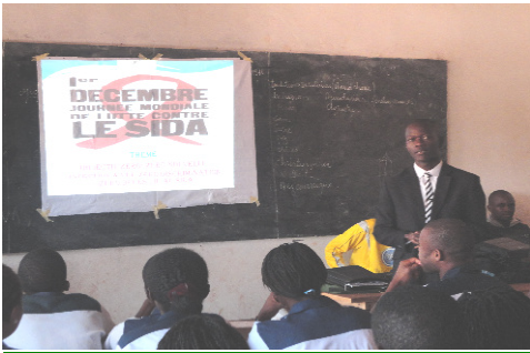
Lutte contre le SIDA

L'année 2011 a été une bonne année pour nous et nous sommes heureux de vous apporter des nouvelles qui ont marqué ce dernier mois de 2011.