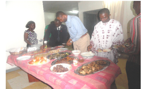
Agapè de fin d'année

Les ELD (Etudes de Leadership et de Développement) ne cessent de fouler des terrains vierges. Ce mois-ci, l'enseignement des ELD ont effectivement commencé dans la Section Anglophone du Collège IPONI au bon plaisir des élèves de ces classes qui se sentaient lésés. Le département des ELD réalise un réel progrès dans son programme pour l'année académique de 2011-2012. Cette photo montre les membres de ce département dans une séance d'harmonisation récente des ELD.