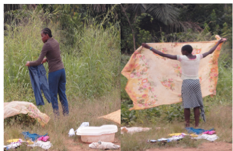
Visite à l'orphelinat

Chaque année le 1 er Décembre à lieu la Journée mondiale de lutte contre le VIH sida. Cette année, la Ligue des Jeunes Leaders a organisé des activités dans tous les collèges partenaires pour sensibiliser les jeunes sur les dangers de cette maladie, les moyens de l'éviter et la nécessité d'assister et d'aider les personnes atteintes du VIH sida. La Ligue des Jeunes Leaders s'est démarqué dans cette journée par la projection de films éducatifs, des conférences et la production des supports illustratifs en bande dessinée.